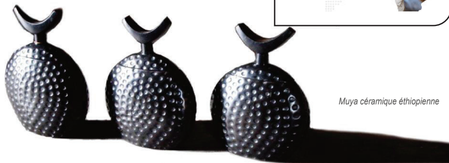
Muya céramique éthiopienne